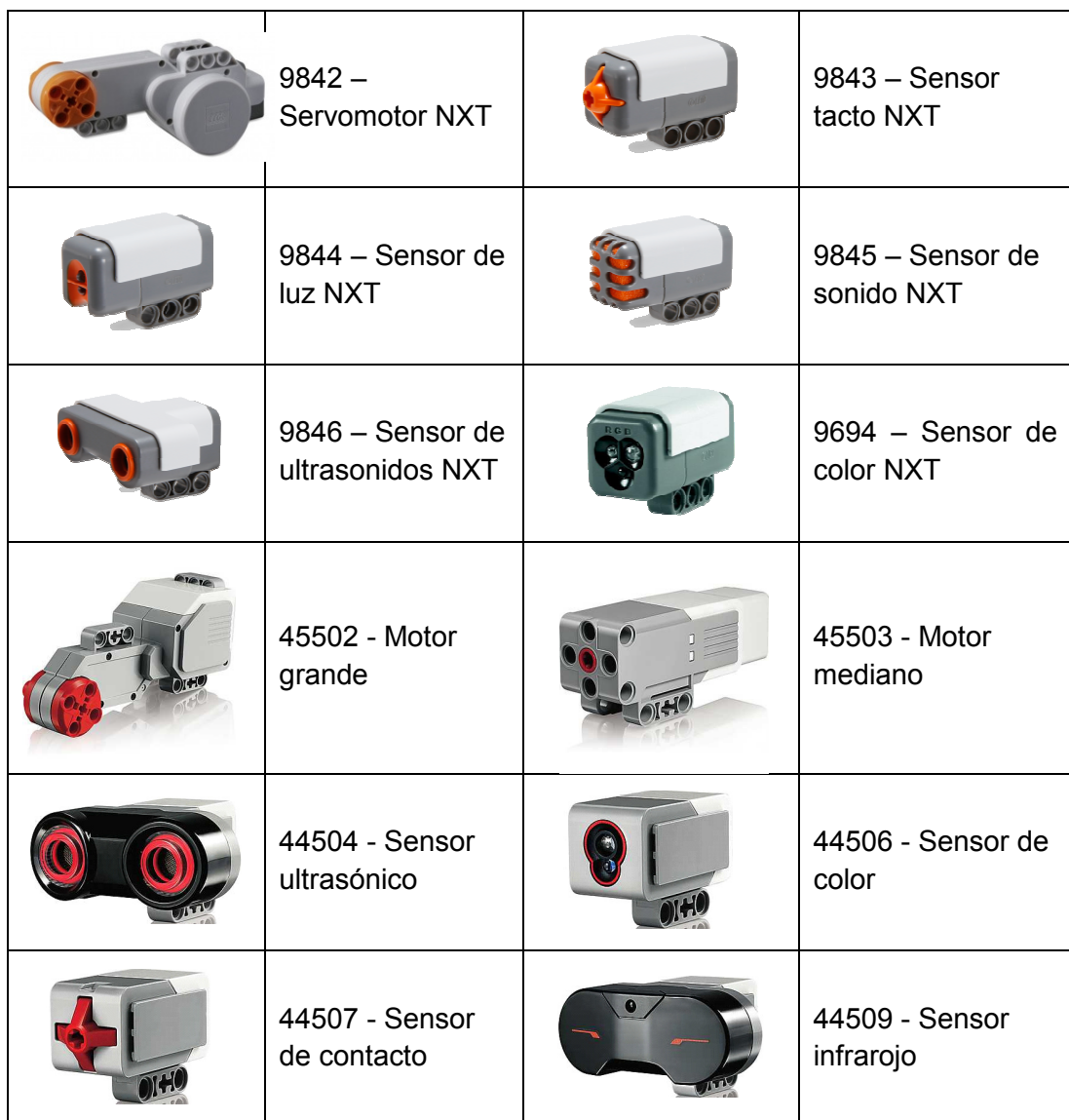
Tabla de los motores y sensores permitidos: